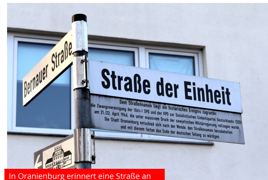
In Oranienburg erinnert eine Straße an die Zwangsvereinigung von SPD und KPD

Die Resolution aus Oranienburg beschreibt zugleich die dramati-