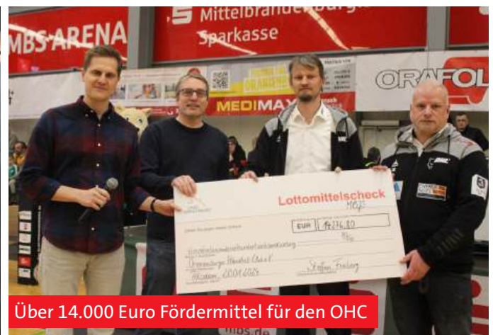
Über 14.000 Euro Fördermittel für den OHC