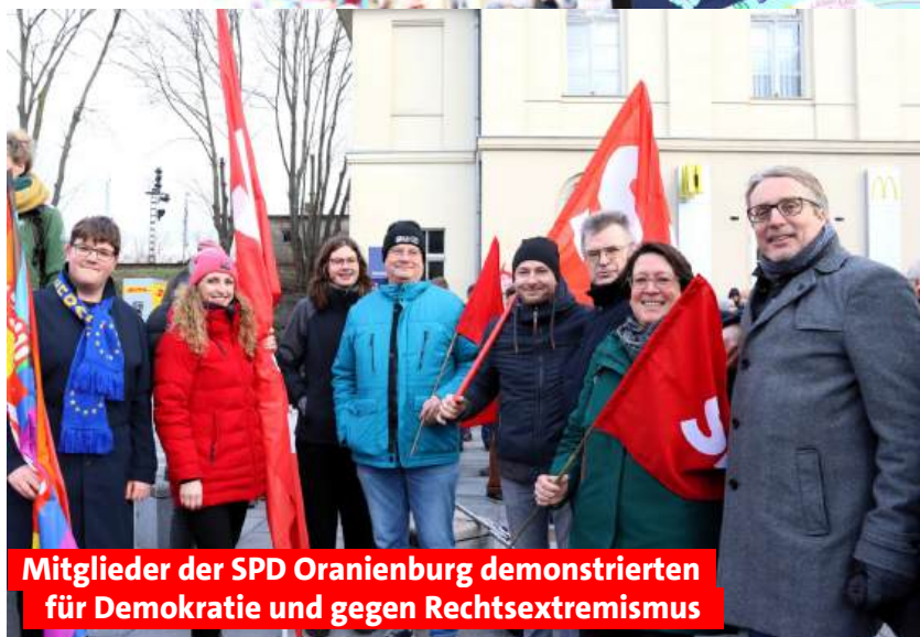
Mitglieder der SPD Oranienburg demonstrierten für Demokratie und gegen Rechtsextremismus

Beide unterstellen der Regierung und den demokratischen Parteien „im Auftrag fremder Mächte“ gegen das Volk zu handeln. Beiden geht es um bewusste Grenzverschiebungen und Provokationen sowie darum, unseren demokratischen Staat in Frage zu stellen. Hinzu kommt eine enge Verstrickung insbesondere der AfD Brandenburg zu vielen Vorfelddorganisationen der sogenannten „Neuen Rechten“, die ihren Rechtsextremismus teils deutlich offener ausleben als die AfD selbst.