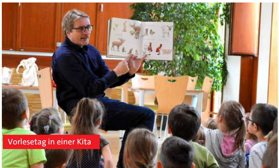
Vorlesetag in einer Kita