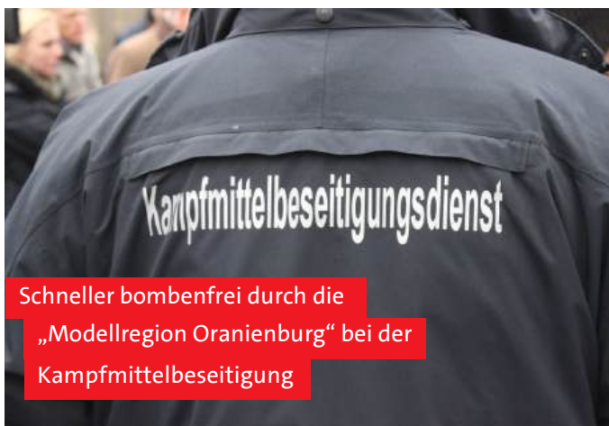
Schneller bombenfrei durch die „Modellregion Oranienburg“ bei der Kampfmittelbeseitigung