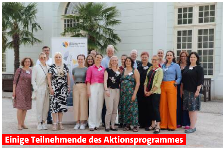
Einige Teilnehmende des Aktionsprogrammes

Am Ende des Programms fühlte ich mich ermutigt, mich für ein Kreistagsmandat aufstellen zu lassen und jetzt sitze ich im Kreistag. Ich werde oft gefragt, warum ich mir Parteilinie auch noch ans Bein binde und ob ich keine Hobbys habe. Diese Fragen bekommen viele Menschen im Ehrenamt gestellt. Natürlich habe ich auch Hobbys, eins davon ist jetzt die Politik. Und die reale Möglichkeit, Einfluss auf Veränderungen in unserer unmittelbaren Umgebung zu nehmen, von Menschen, Frauen und Männern aller Altersgruppen, führt dazu, dass sich Politik verändert. Sie wird jünger, vielfältiger und auch weiblicher.“